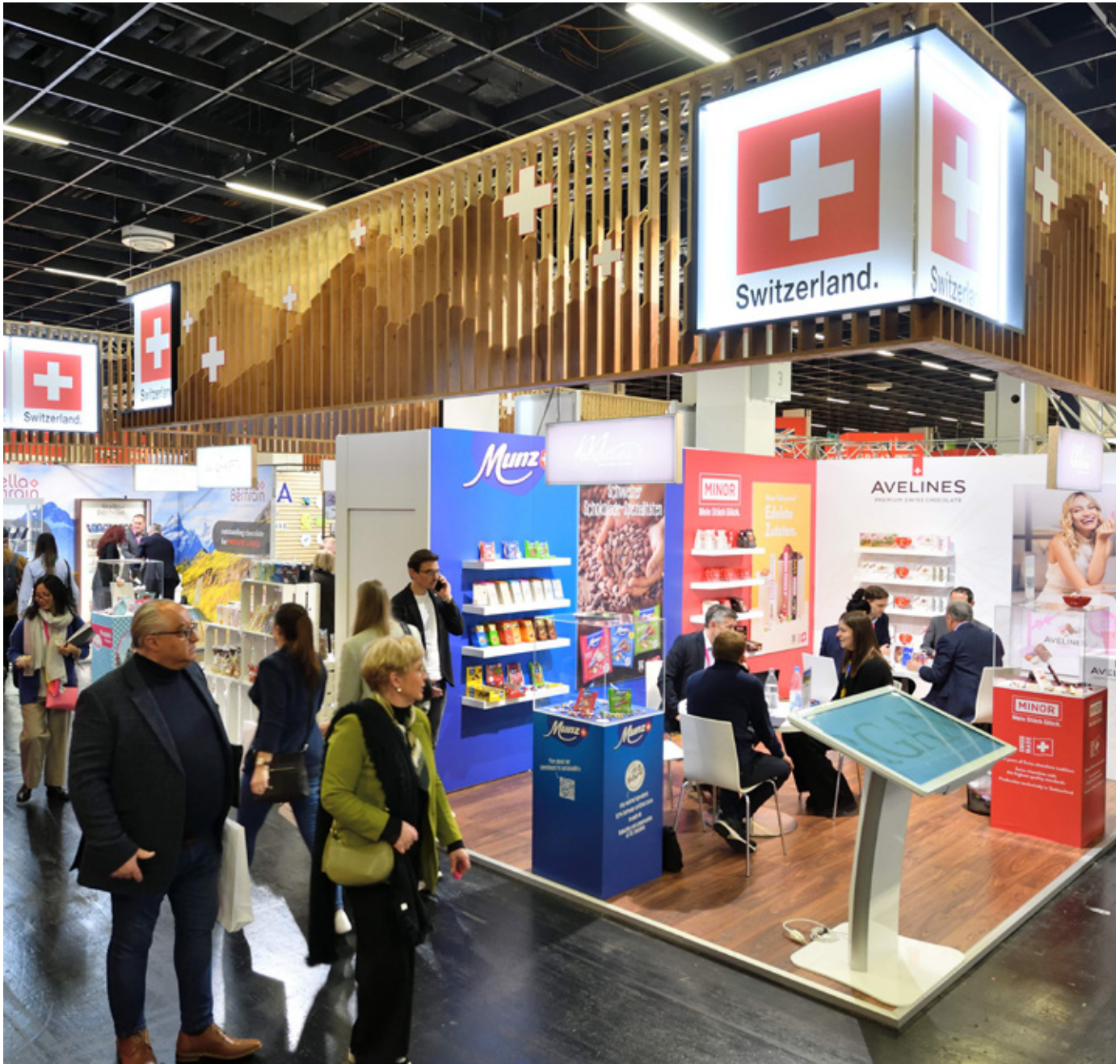
Photo: Vu la forte demande, il a été possible d'organiser plus de salons en 2024 qu'en 2023